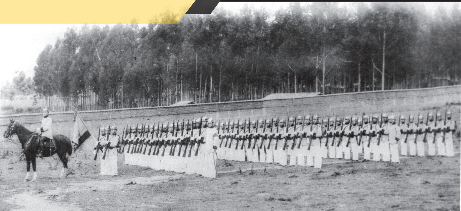
Cadetes en instrucción en el año de 1911 en el sector de la Magdalena

cinco décadas ha crecido experimentando modificaciones que, en la actualidad, se han consolidado gracias al convenio existente con la Universidad de Fuerzas Armadas. En el año de 1974 se adquirió la hacienda de Parcayacu y se inició la construcción de sus nuevas y definitivas instalaciones, en las cuales comenzó a funcionar a partir del 4 de octubre de 1981, a partir de esta fecha se produce la separación de la Escuela y Colegio, cada uno creado con una misión específica, el Colegio dedicado a la formación de bachilleres y la Escuela a formar los futuros Oficiales de la Fuerza Terrestre.