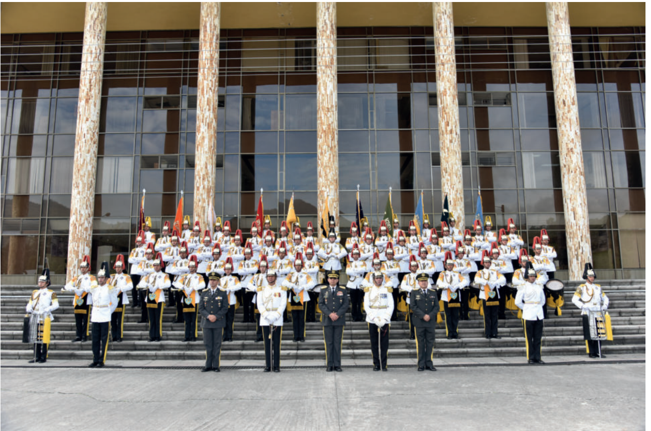
Pelotón Comando y Estado Mayor 2023