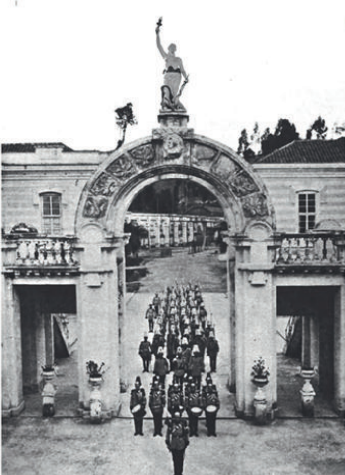
1915 colegio militar en el sector de la Recolecta (actual Ministerio de Defensa)

La Escuela Militar nace en la nueva República en 1838, bajo el gobierno de Don Vicente Rocafuerte, quien comprendió que para consolidar el nuevo Estado era indispensable contar con soldados capaces y de honor; por ello dispone mediante Decreto Ejecutivo firmado el 8 de marzo de 1838 la creación del Colegio Militar, mismo que fue inaugurado el 7 de mayo del mismo año en el Convento de San Buenaventura, cerca del histórico templo de San Francisco, donde funcionó durante 7 años.