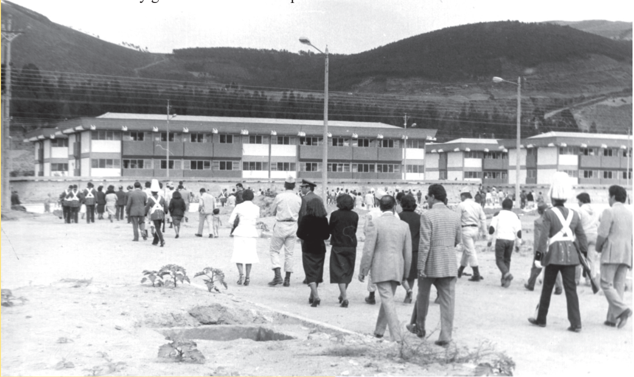
ESMIL en el año de 1981

nuevos escenarios y de esa manera sigue graduando hasta la presente fecha, subtenientes profesionales, comprometidos con el país y su gente y sobre todo orgullosos de un pasado histórico de 185 años de tradición de honor y gloria herederos de la promitente historia del Ecuador.