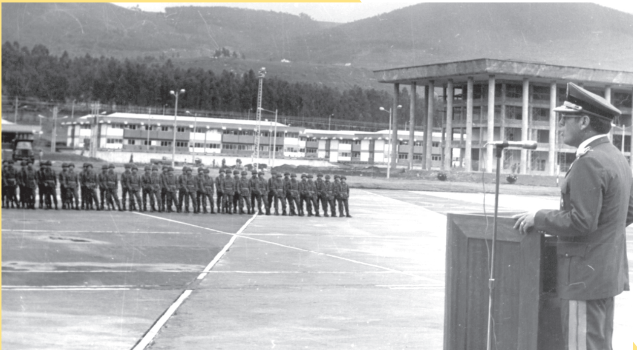
Cadetes en el campo de marte, año 1982