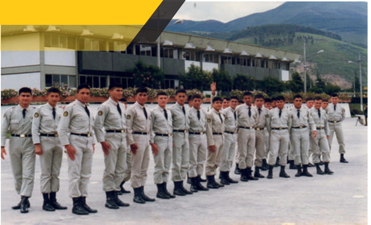
Cadetes de las ESMIL en el año de 1984