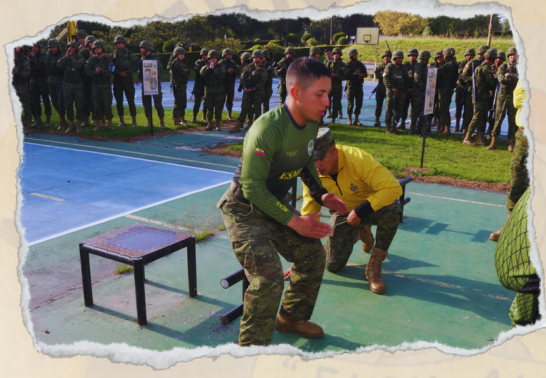
CROSSFIT (ANGIE - EMOM)