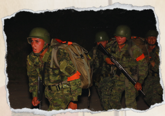
RECORRIDO 10 KM (ARMADO Y EQUIPADO)