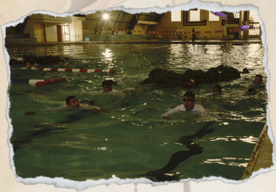
PRUEBAS DE NATACIÓN (SALTO DE DECISIÓN, TRANSPORTE DE MATERIAL)