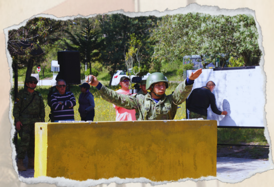
LANZAMIENTO DE GRANADA